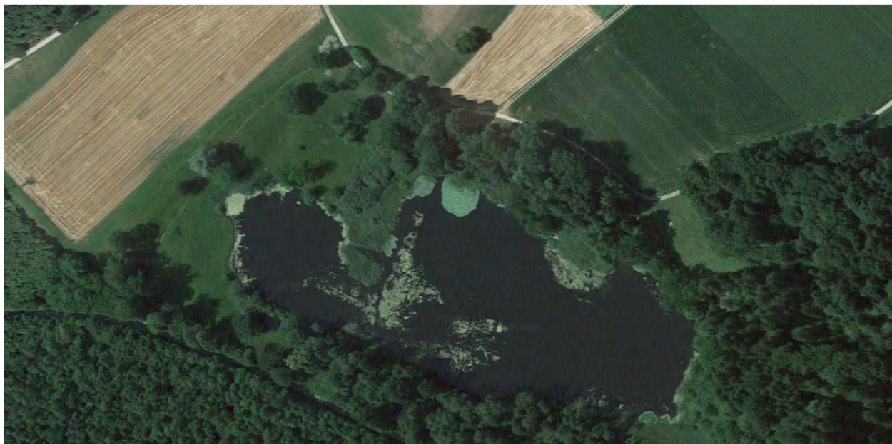
Abbildung 2: Fischbacher Moos: Flach- und Hochmoor sowie Amphibienlaichgebiet gemäss Bundesinventaren